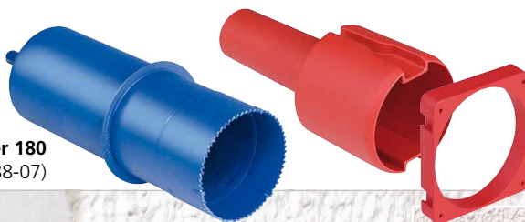
Setzwerkzeug Styro55 (1090-21)