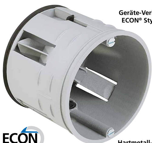
Geräte-Verbindungsdose ECON® Styro55(1555-51)